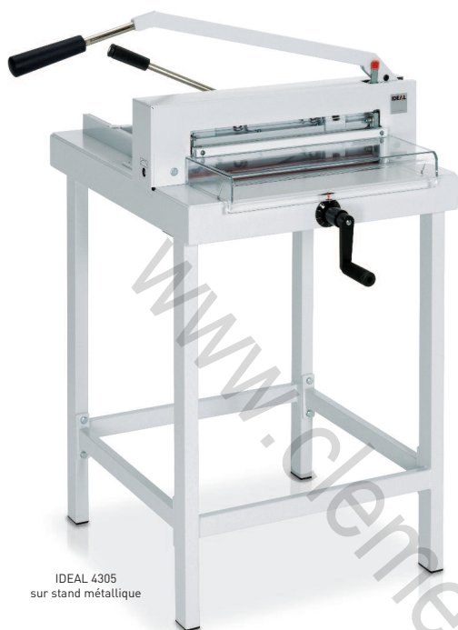
IDEAL 4305 sur stand métallique