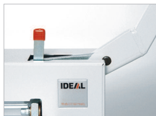
Dispositif de blocage de lame (levier en position haute).