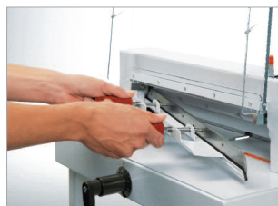
Dispositif de changement de lame protégeant le tranchant.